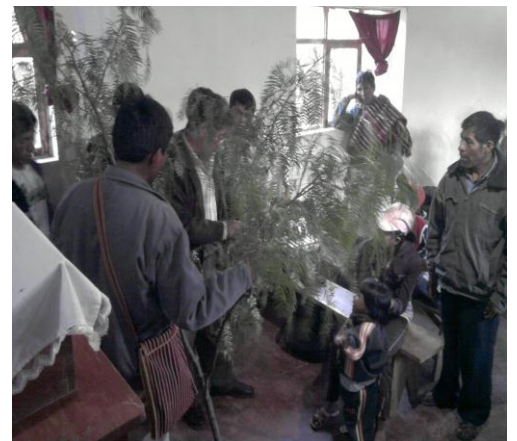
Los participantes, dramatizando lo aprendido