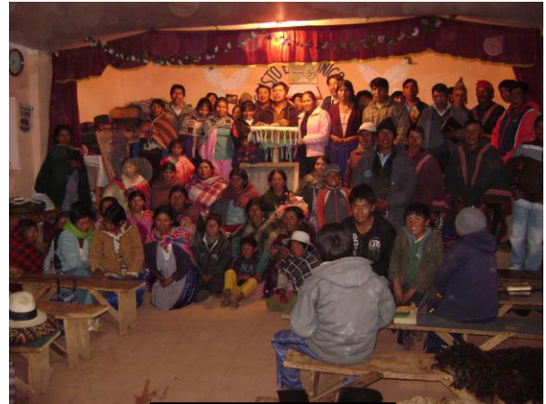
Participantes del taller