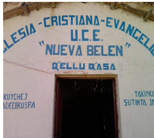
La capilla donde se realizó los talleres