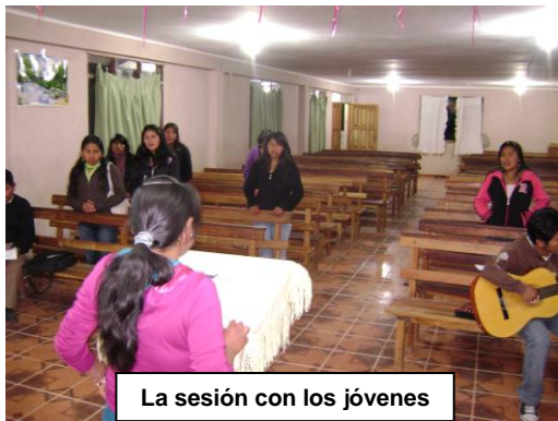
La sesión con los jóvenes

Continuando con el fortalecimiento de las iglesias de Sucre, también se llevó a cabo dos conferencias de sensibilización y visión en la Iglesia “Betel” – UCE, del Barrio Planta de Agua, el sábado en la noche con su ministerio juvenil (castellano), y domingo con los de habla quechua.