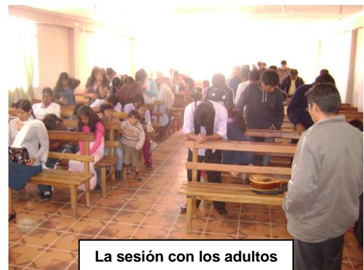
La sesión con los adultos