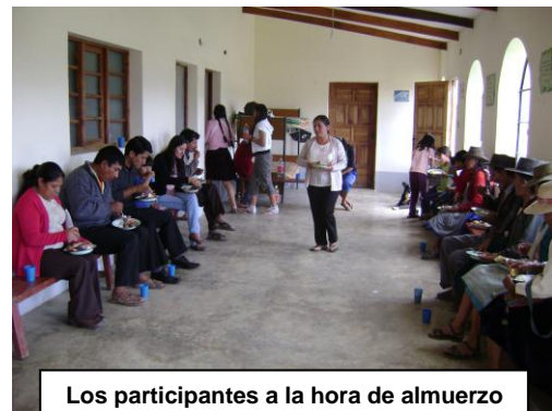
Los participantes a la hora de almuerzo