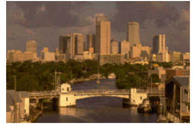
Pie de imagen o gráfico.

una manera fácil de convertir el boletín en una publicación para el Web. Por tanto, cuando acabe de escribir el boletín, conviértalo en sitio Web y publíquelo.