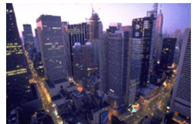
Pie de imagen o gráfico.

importar a su boletín, además de herramientas para dibujar formas y símbolos. Una vez seleccionada la imagen, colóquela cerca del artículo. Asegúrese de que el pie de imagen está próximo a la misma.