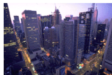
Pie de imagen o gráfico.

importar a su boletín, además de herramientas para dibujar formas y símbolos. Una vez seleccionada la imagen, colóquela cerca del artículo. Asegúrese de que el pie de imagen está próximo a la misma.