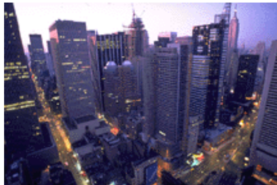
Pie de imagen o gráfico.

Si dispone de espacio, puede insertar una imagen prediseñada o algún otro gráfico.