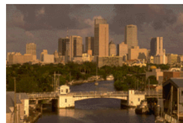
Pie de imagen o gráfico.

una manera fácil de convertir el boletín en una publicación para el Web. Por tanto, cuando acabe de escribir el boletín, conviértalo en sitio Web y publíquelo.